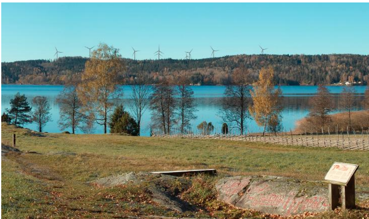
Fotomontage som visar område B4 sett från Tisselskogs hällristningsområde.