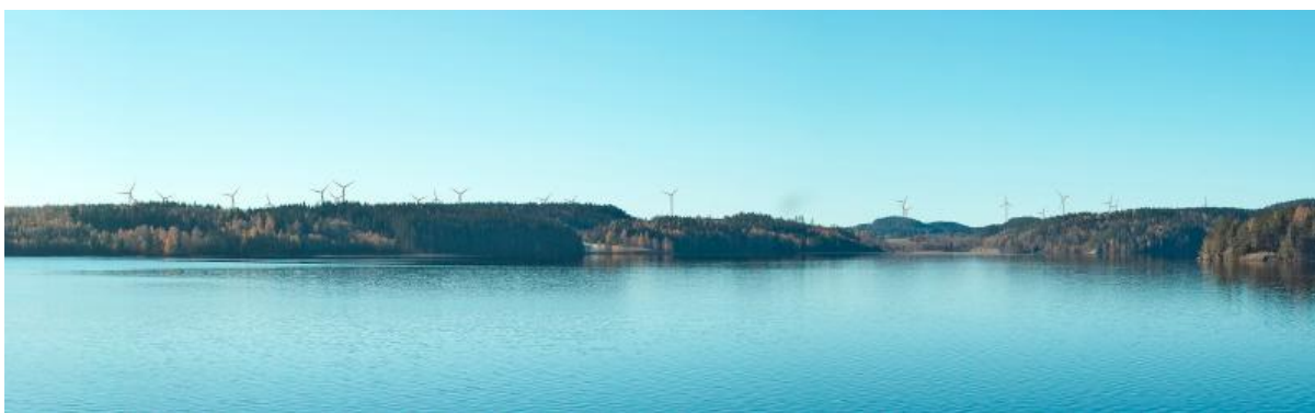
Fotomontage som visar område B6 sett från norra stranden av Iväg.

Det nu föreliggande planförslaget innebär att Bengtsfors kommun med marginal når upp till kommunens ytmässiga andel av det nationella vindkraftsmålet.