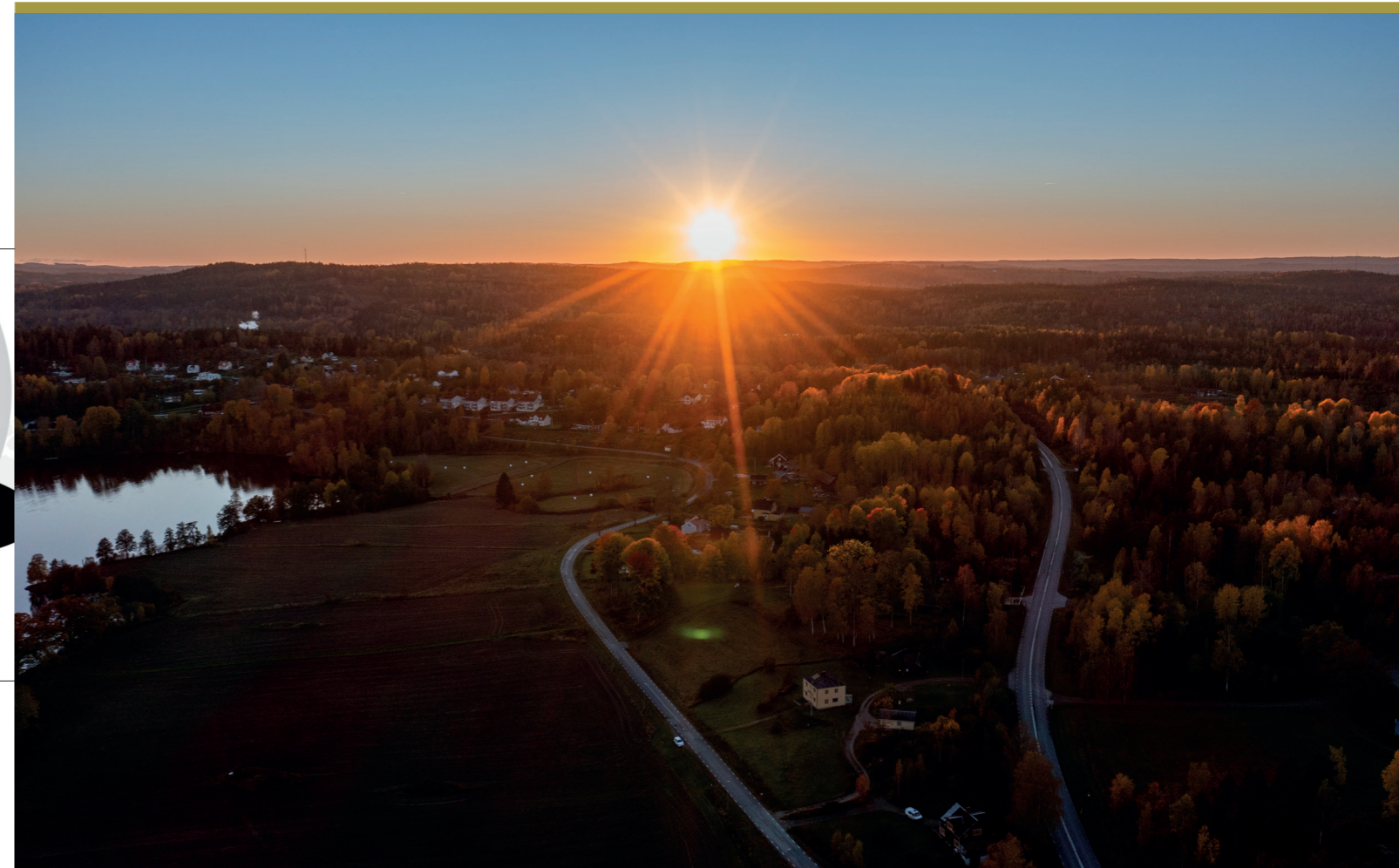
Solnedgång i Skåpafors.

NYHETSSLUSSEN FÖR DIG SOM BOR I BENGTSFORS KOMMUN